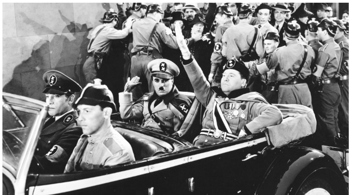
Hitler és Mussolini, valamint Hynkel és Napolitano