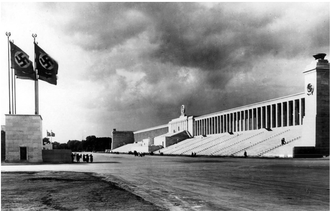
Zeppelin-tribün, melyet Adolf Hitler felszólalásai és a Nemzetiszocialista Párt tömeggyűlései számára építettek