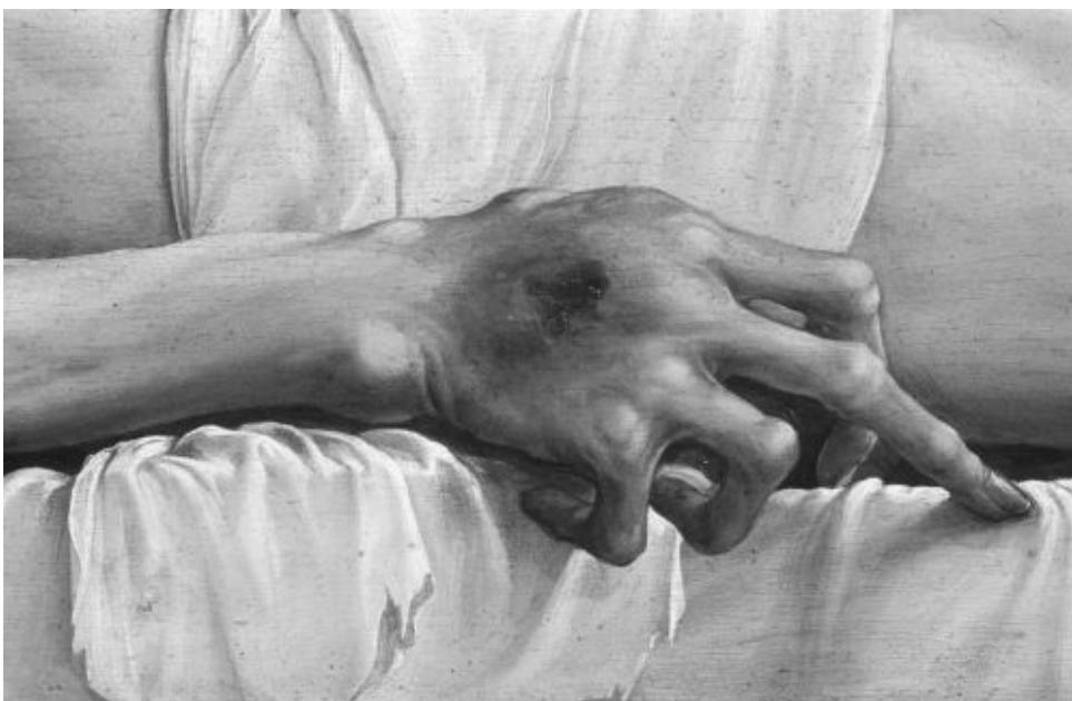
Holbein: Halott Krisztus