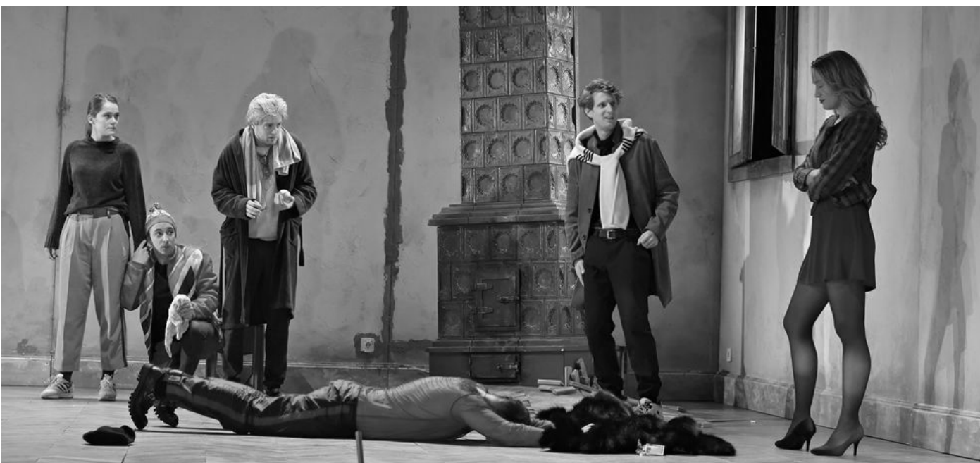
Jelenet az előadásból

Dosztojevszkij az emberi lélek legpontosabb ábrázolására törekedett. Olyan író volt, aki a pszichológiához is közel állt. „Teljes realizmus mellett megtalálni az emberben az embert... Pszichológusnak neveznek; nem igaz, én csupán realista vagyok a szó magasabb értelmében, azaz az emberi lélek teljes mélységét ábrázolom.” nyilatkozta, amikor írásairól kérdezték. Dosztojevszkij igyekszik olyan helyzetekbe hozni figuráit, melyekben lelkük (mint ő maga mondja) teljes mélységben meg tud mutatkozni. Átlagostól, mindennapitól eltérő pillanatokban látjuk hőseit, akik gyilkosságokat követnek el, halálos betegségekben szenvednek, megalázzák őket, vagy éppen munkatáborokban küzdenek. Szövegeinek főszereplői kívülállók, lázadók, akik a fennálló rendet képtelenek vagy nem is akarják betartani. Raszkolnyikov, a Bűn és bűnhődés főalakja például gyilkol egy új világelrendezkedés nevében és érdekében. Az egyén világjobbító tettei és más emberek szabadságának korlátozása visszatérő motívum műveiben. Lehet-e gyilkosságok árán boldogságot hozni az emberiségnek? – teszi fel a kérdést Dosztojevszkij. Gyakran jelennek meg önéletrajzi jellegű motívumok, leírások műveiben. Elég, ha csak A játékos című szövegére gondolunk, melyben a játékszenvedélyről ír, vagy a Félkegyelműre, mely egy halálraítélt lelkiállapotát írja le a kivégzés előtt, majd az utolsó pillanatban érkező felmentés után.