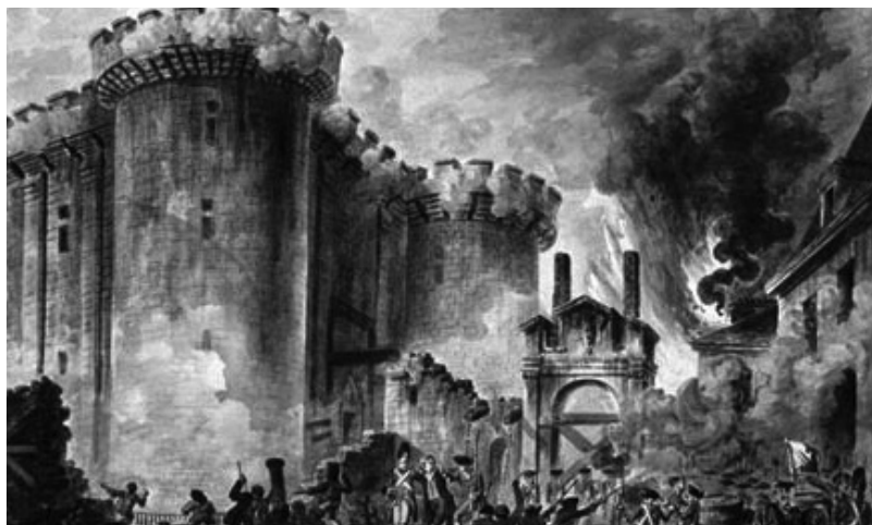
A Bastille ostroma

A jakobinusok egyre mérsékeltebb klubja, mely egyre több kompromisszumra volt hajlandó. Egyértelműen elutasítja a Robespierre-féle terrort és vérengzést.