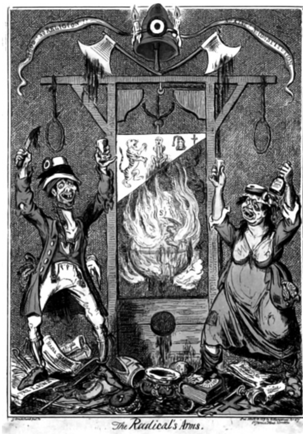
Karikatúra a francia forradalomról

Hasonlítsuk össze a karikatúrát Delacroix alkotásával. Mit figuráz ki a karikatúra? Kik szerepelnek ezen a képen? Milyen motívumok jelennek meg mindkét képen, és melyekben különbözik a két kép?