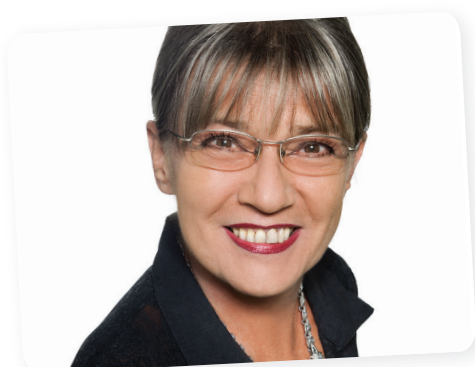
Kútvölgyi Erzsébet Páger-díj