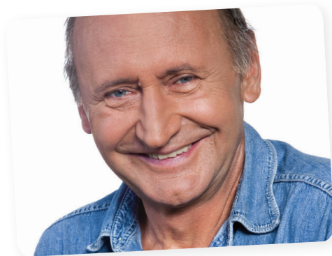
Reviczky Gábor Kossuth-díj