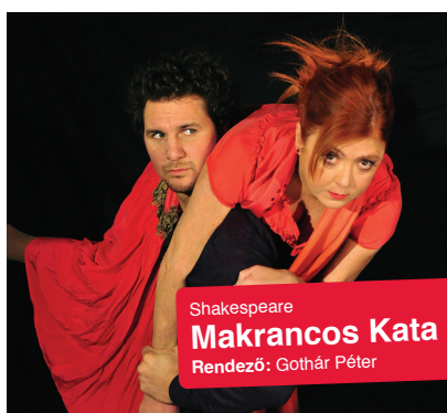
Shakespeare Makrancos Kata Rendező: Gothár Péter