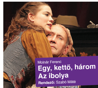
Molnár Ferenc Egy, kettő, három Az ibolya Rendező: Szabó Máté