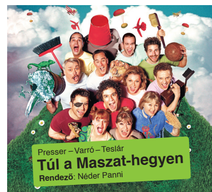
Presser – Varró – Teslár Túl a Maszat-hegyen Rendező: Néder Panni