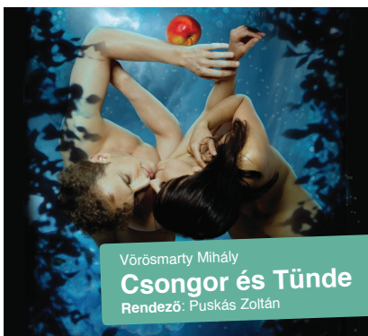
Vörösmarty Mihály Csongor és Tünde Rendező: Puskás Zoltán