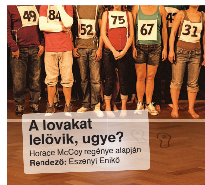
A lovakat lelővik, ugye? Horace McCoy regénye alapján Rendező: Eszenyi Enikő