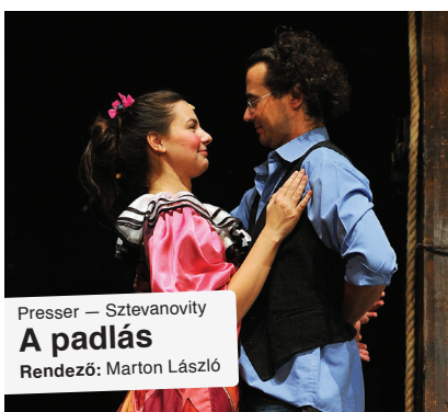
Presser — Szevanovity A padlás Rendező: Marton László