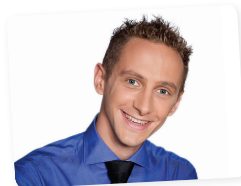
Józán László Junior Prima Díj