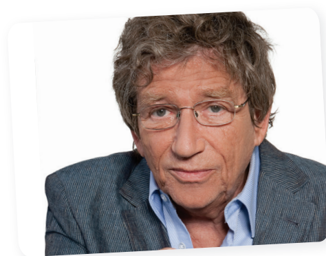
Kern András Életműdíj – VIDOR Fesztivál