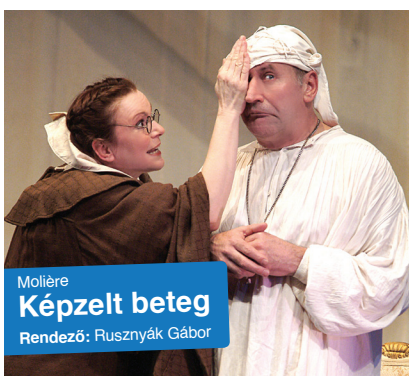
Molière Képzelt beteg Rendező: Rusznyák Gábor