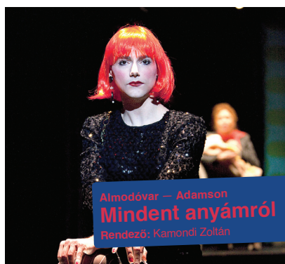
Almodóvar — Adamson Mindent anyámról Rendező: Kamondi Zoltán