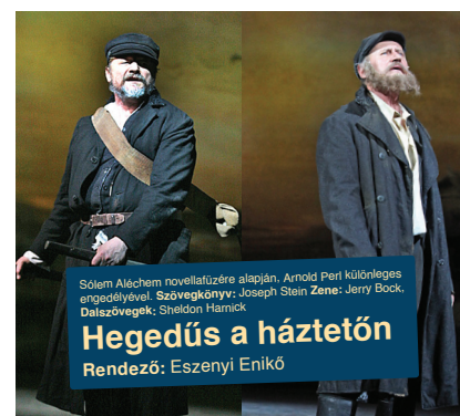
Sólem Alechem novellatuzére alapján. Arnold Perl különleges engedélyével. Szövegkönyv: Joseph Stein Zene: Jerry Bock, Dalszövegek: Sheldon Hamick Hegedűs a háztetőn Rendező: Eszenyi Enikő