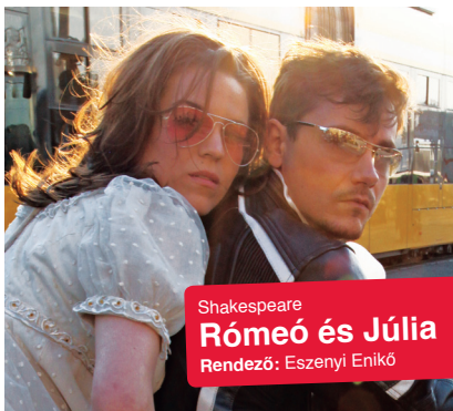
Shakespeare Rómeó és Júlia Rendező: Eszenyi Enikő