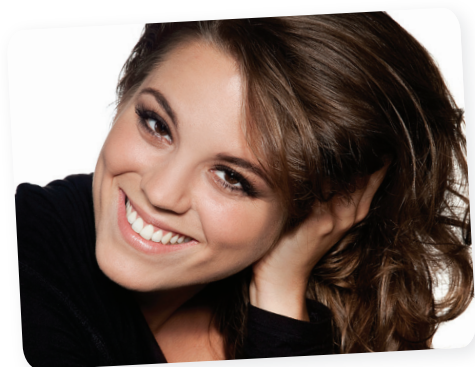
Bata Éva Soós Imre-díj