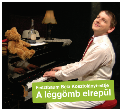
Fesztbaum Béla Kosztolányi-estje A léggömb elrepül