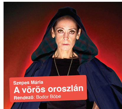
Szepes Mária A vörös oroszlán Rendező: Bodor Bóbe