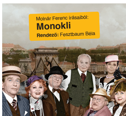
Molnár Ferenc írásaiból: Monokli Rendező: Fesztbaum Béla