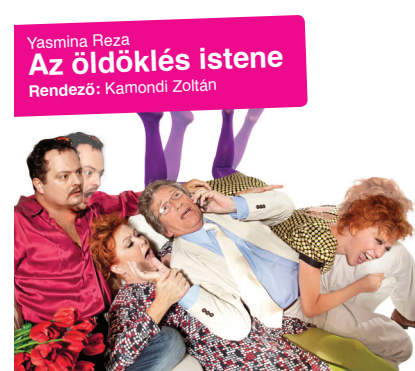
Yasmina Reza Az öldöklés istene Rendező: Kamondi Zoltán