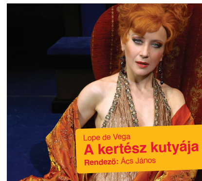
Lope de Vega A kertész kutyája Rendező: Ács János