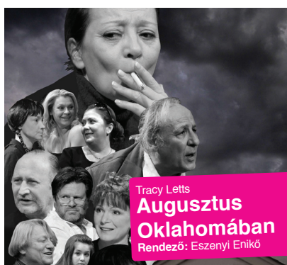
Tracy Letts Augusztus Oklahomában Rendező: Eszenyi Enikő