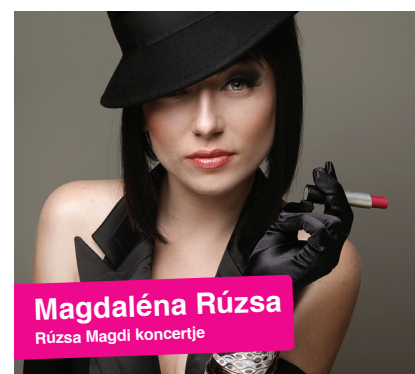
Magdalena Rúzsa Rúzsa Magdi koncertje