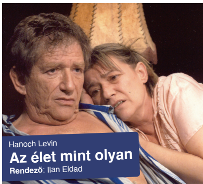
Hanoch Levin Az élet mint olyan Rendező: Ilan Eldad