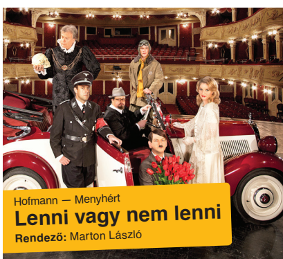
Hofmann — Menyhért Lenni vagy nem lenni Rendező: Marton László