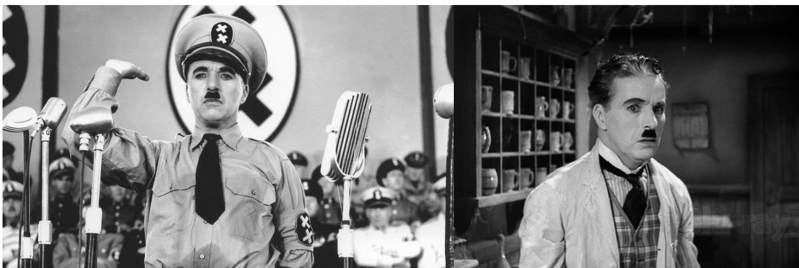
Chaplin, a film két szerepében

Annak ellenére, hogy a szereplők megszólalnak a filmben és zenei aláfestés is hallható, a némafilm korszakából átvett elemeket sem nélkülözi a mű. Különösen a két diktátor, Hynkel és Napaloni vetélkedésének jeleneteit jellemzik a mozgásokra és gesztusokra épülő gag-ek. Chaplin színészi erejét mutatja, hogy kettős szereposztásban mutatkozik meg, ő játssza a diktátort (az üldözőt) és a zsidó borbélyt (az üldözöttet) is. A kettős szereposztásnak dramaturgiai jelentősége van, hiszen az utolsó jelenet előtti félreértéses felcserélés jelenet után a zsidó borbély kerül a szószékre, ahonnan elmondhatja humanista és békét hirdető üzenetét a tömegeknek. Az üldöző és az üldözött azonosságának fontos jelentésrétege, hogy bárki lehet üldöző és bárki lehet üldözött is. A szerepek felcserélhetők és a történelem viharában mindenki kerülhet kiszolgáltatott helyzetbe. Mindannyian emberek vagyunk, és különbözőségeink ellenére rengeteg mindenben hasonlítunk – üzenik Chaplin képkockái.