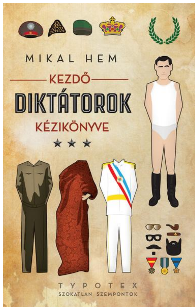
A könyv magyar kiadásának borítóját