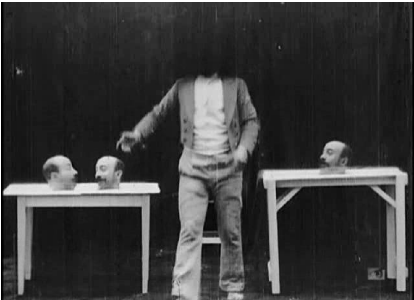
Korabeli filmes trükk

A valóságot bemutató részletek után nem sokkal megszülettek az első színészek által játszott filmjelenetek is. Ezek a rövid jelenetek, apró tréfákat, bohócszámokat tartalmaztak és már első megjelenésükkor kihasználták a film kínálta egyedülálló lehetőséget: a vágást. A filmkockák szétvágásával és összeillesztésével időugrásokat, pozícióváltoztatásokat, figurák megkettőzését, magasság és mélység eltorzítását és még számos trükköt tudtak végrehajtani a filmkészítők. A vágás, a kameraállással való játék és a filmkockák egymásba úsztatásának technikáját kihasználva megszületett a filmművészet egyik legtermékenyebb műfaja: a burleszk. Ebben a műfajban alkot maradandót a Diktátor című film rendezője, producere, zeneszerzője és főszereplője: Charlie Chaplin.