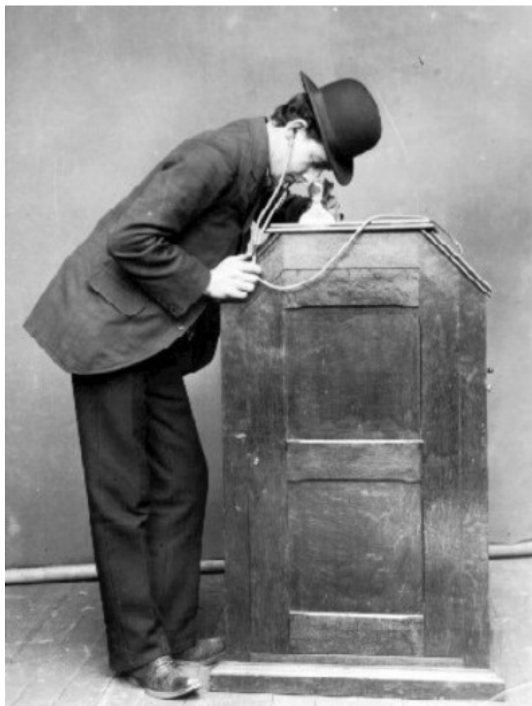
Edison filmvetítő gépe

Az első vetítések filmhíradó jellegű részletekből álltak. A tűzoltók kivonulásának vagy a kovácsok munkájának rögzítése és visszanezése csoda számba ment, és a mozgó kép látványa megbabonázta a nézőket. A jeleneteket elsősorban színházi előadások szüneteiben vagy kisebb helyiségekben, alkalmilag vetítették. Az első, kimondottan moziműsorra építő intézmények a nickelodeon-ok voltak [nickel – 5 centes, odeon – színház], melyek, mint nevük is mutatja olcsón kínáltak 10-20 perces filmeket 1905-től.