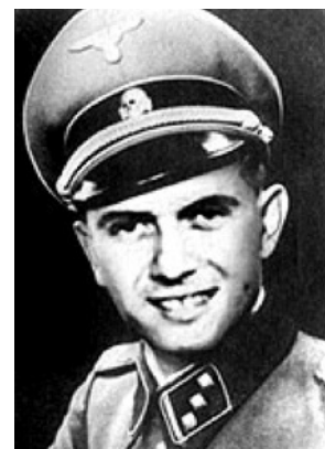
Dr. Josef Mengele