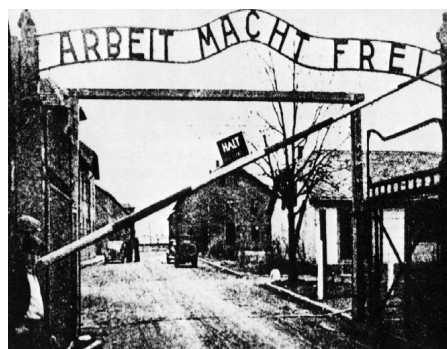
Az auschwitzi koncentrációs tábor bejárata